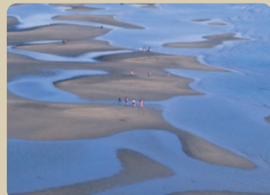
干潟等、環境資源として貴重ななぎさ (新舞子海岸)