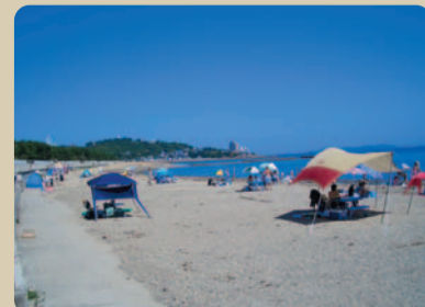
海に親しむことのできるなぎさ (唐船サンビーチ)