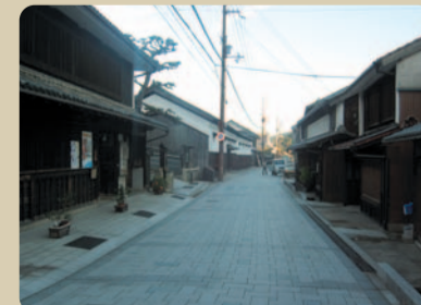
貴重なまち並を観ることのできるなぎさ (坂越のまちなみ)