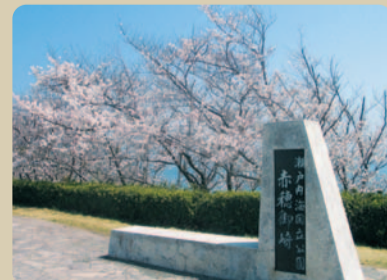
美しい瀬戸内海を眺めることのできるなぎさ (赤穂御崎)

〒678-1205 兵庫県赤穂郡上部町光都 2-25 TEL.(0791)58-2100 FAX.(0791)58-2321 http://web.pref.hyogo.jp/nishiharima/kendonew/kdtop.htm