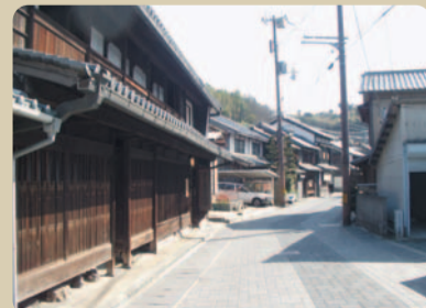
歴史を感じることのできるなぎさ (室津のまちなみ)